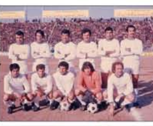
بله من در آن بازی حضور داشتم. ببینید مجموعه عواملی دست به دست هم داد تا منجر به این شد که سران مملکت مصلحت داخلی کشور را در این ببینند که این باشگاه را متحل کنند شاهین متعلق به مردم بود و در آن اواخر وقتی نتوانستند جلوی اعتراض مردم به سیستم اداره مملکت در ورزشگاه ها را بگیرند گفتند که تشویق شاهین توسط مردم که یک سمت مجرده میکوبند شاه ۵۰۰۰۰۰۰۰۰۰ و قسستی دیگر پهلپهلپین به نوبی نوبین به شاه مملکت است با هر حال مخالفت مردم خواهواخواه شاهین با سیستم و دستگاه در این انحلال بی تأثیر نبود.